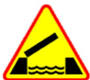
A-13 Ruchomy most