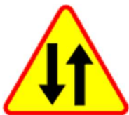
A-20 Odcinek jezdni o ruchu dwukierunkowym