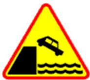
A-27 Nabrzeże lub brzeg rzeki