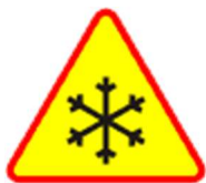
A-32 Oszronienie jezdni