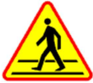
A-16 Przejście dla pieszych