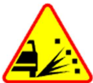
A-28 Sypki żwir