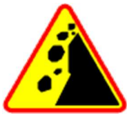
A-25 Spadające odłamki skalne