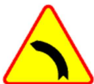
A-2 Niebezpieczny zakręt w lewo