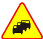
A-33 Zator drogowy