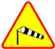
A-19 Boczny wiatr