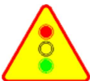
A-29 Sygnały świetlne