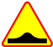
A-11a Próg zwalniający