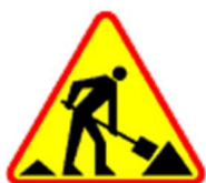
A-14 Roboty drogowe