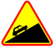
A-23 Stromy podjazd