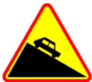
A-22 Niebezpieczny zjazd