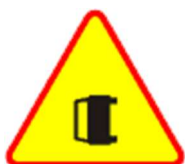
A-34 Wypadek drogowy