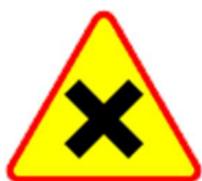
A-5 Skrzyżowanie dróg