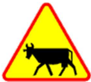
A-18a Zwierzęta gospodarskie