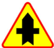
A-6a Skrzyżowanie z drogą podporządkowaną występującą po obu stronach