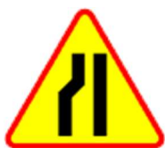
A-12c Zwężenie jezdni - lewostronne