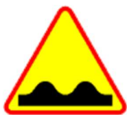
A-11 Nierówna droga