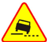
A-31 Niebezpieczne pobocze