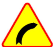
A-1 Niebezpieczny zakręt w prawo

Zobacz jakie są aktualne znaki ostrzegawcze. Znaki te o miejscach na drodze, w których występuje lub może występować niebezpieczeństwo. Nakazują kierowcom zachować szczególną ostrożność.