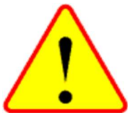
A-30 Inne niebezpieczeństwo