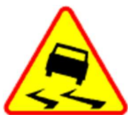
A-15 Śliska jezdnia