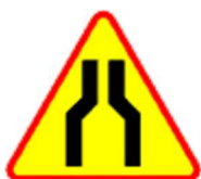
A-12a Zwężenie jezdni - dwustronne