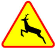
A-18b Zwierzęta dzikie