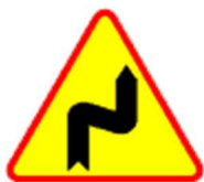
A-3 Niebezpieczne zakręty, pierwszy w prawo